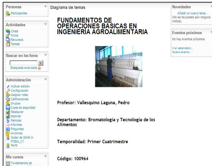
Figura 2: página Moodle ligada a la asignatura tratada