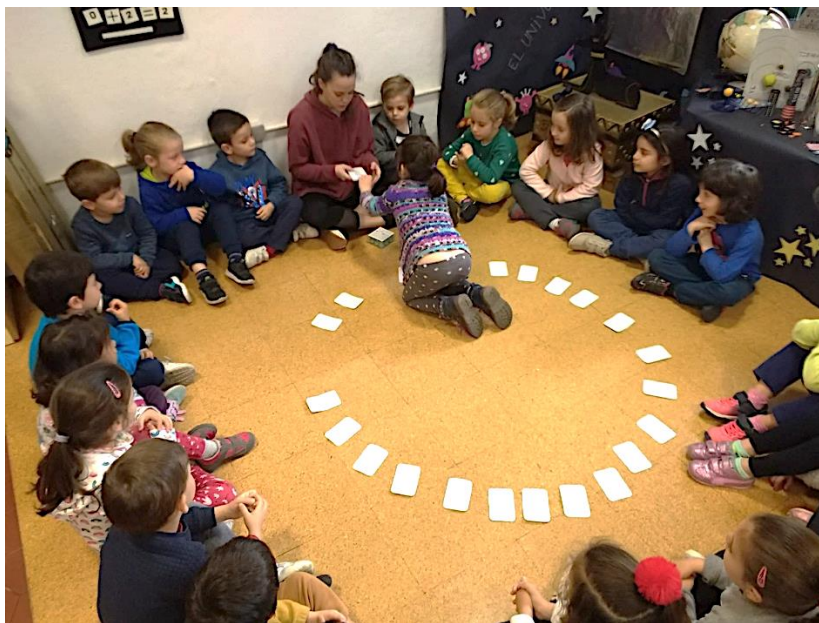
Figura 3. Estudiante liderando una sesión de aprendizaje mientras es observada por la docente-tutora

“No es lo mismo que cuando estás tu sola en el aula... Cuando somos dos, una tira para un lado, otra tira para otro, una atiende a unos, otra atiende a otros... y luego, compartimos” (Docente 8).