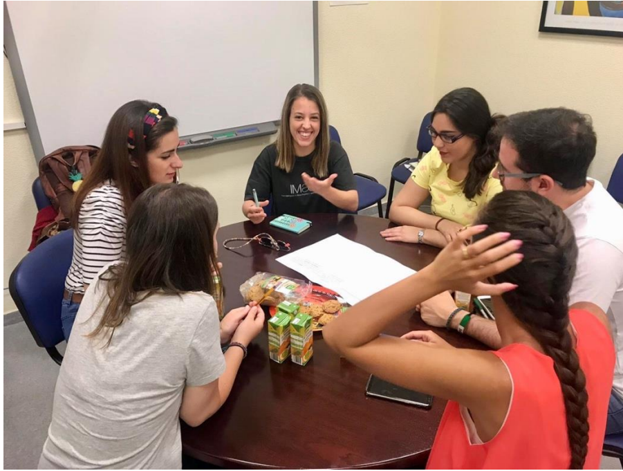
Figura 1. Grupo focal con alumnado universitario