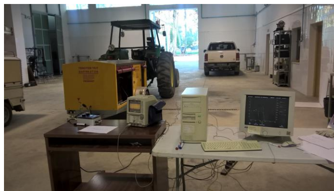
Figura 2. Freno dinamométrico electrónico (Froment, xt 330) y sistema de toma de datos