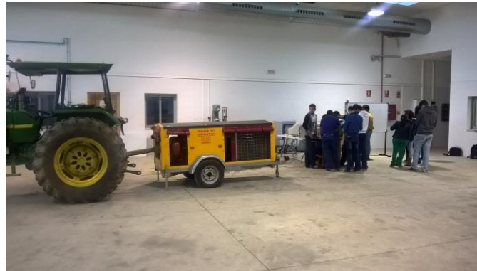
Figura 1. Tractor agrícola en ensayo y alumnos en grupo reducido durante la actividad.